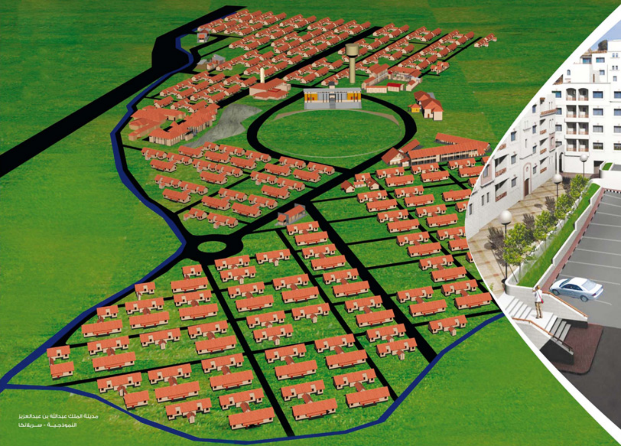
مدينة الملك عبدالله بن عبدالعزيز النموذجية - سريلانكا