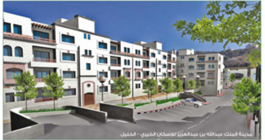
مدينة الملك عبدالله بن عبدالعزيز للإسكان الخيري - الخليل